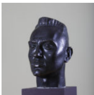
autoportret, 1930 r., brąz