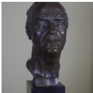
J. Czochralski, brąz, 1944 r