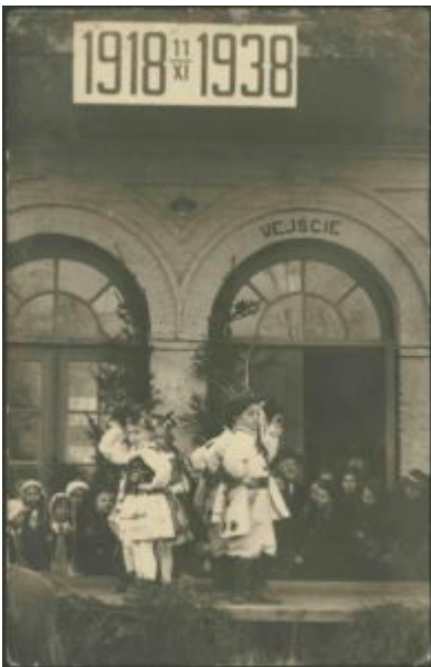
Przedszkolaki „Rodziny Kolejowej” podczas występu na uroczystości Święta odzyskania przez Polskę niepodległości, Starosielce 11.11.1938