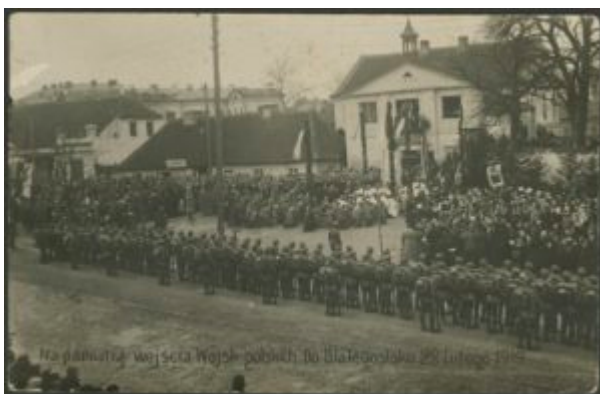
Uroczystości przed kościołem farnym z okazji wejścia Wojsk polskich do Białystoku