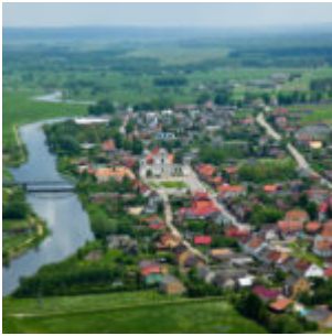
Tykocin z lotu ptaka.