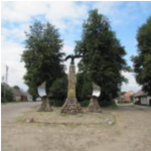
Pomnik Orła Białego.