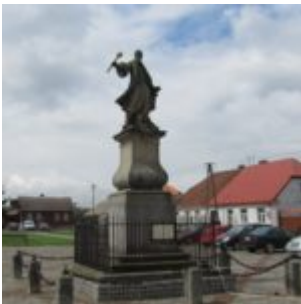
Pomnik Stefana Czarnieckiego.