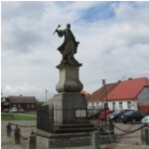
Pomnik Stefana Czarnieckiego.