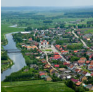
Tykocin z lotu ptaka.