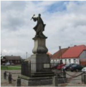
Pomnik Stefana Czarnieckiego.