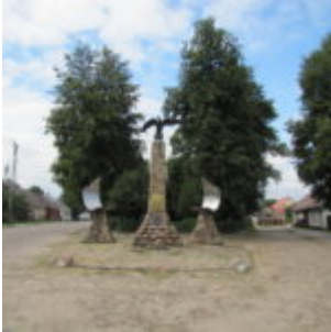
Pomnik Orła Białego.