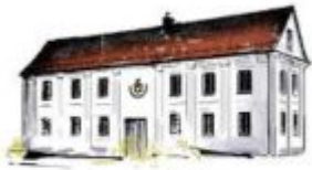
Centrum Kultury, Sportu i Turystyki Ziemi Tykocińskiej