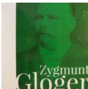
Zygmunt Gloger, Pisma rozproszone, t. 1