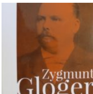
Zygmunt Gloger, Pisma rozproszone, t. 2